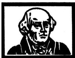
Dr. Samuel Hahnemann